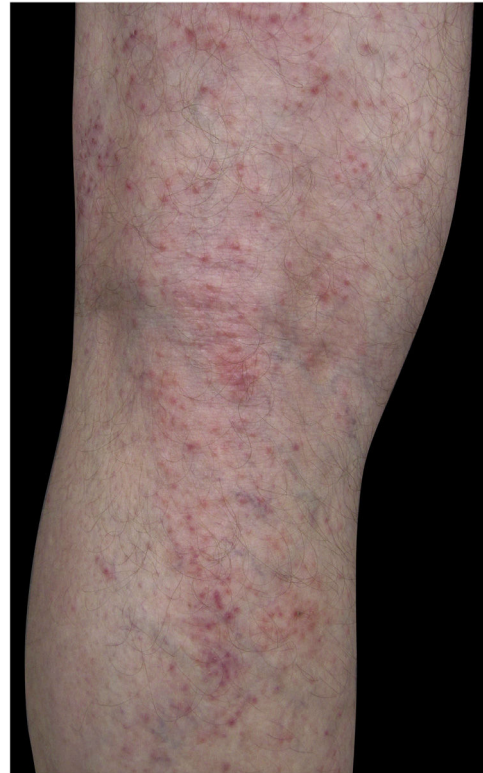
Figura 1 Eczema no membro inferior por dermatite alérgica de contato a corticosteroide.

De acordo com a literatura, os principais fatores de risco para DAC a corticosteroides são: presença de dermatoses