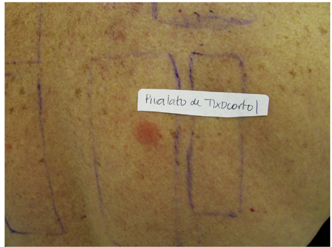
Figura 3 Teste de contato positivo para pivalato de tixocortol.

Além disso, cinco (83,3%) dos pacientes eram polissensibilizados, ou seja, apresentaram três ou mais reações