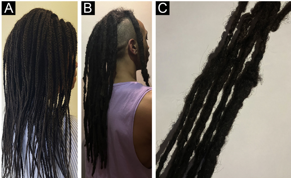
Figura 3 Diferentes tipos de dreadlocks (A-B). Imagem em close-up (C) que mostra como o cabelo despenteado é torcido para formar esses cachos chamados de “locks”.