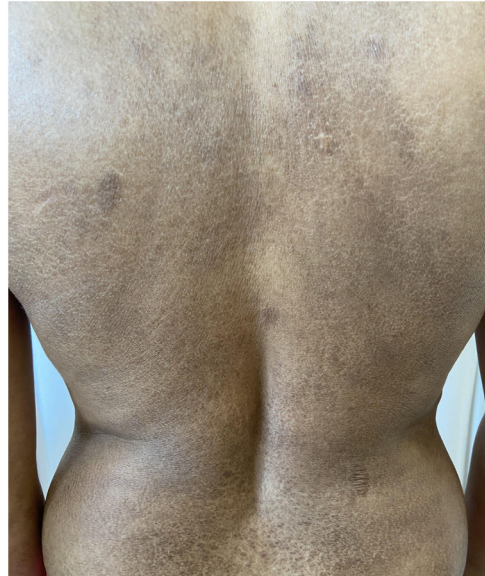
Figura 1 Placas hipercrômicas com descamação ictiosiforme no tronco posterior.

Tomografias computadorizadas cervical, torácica, abdominal e pélvica não apresentaram alterações. Hemograma, plaquetas, função hepática, renal, desidrogenase lática, beta-2-microglobulina e TSH dentro dos limites da norma-