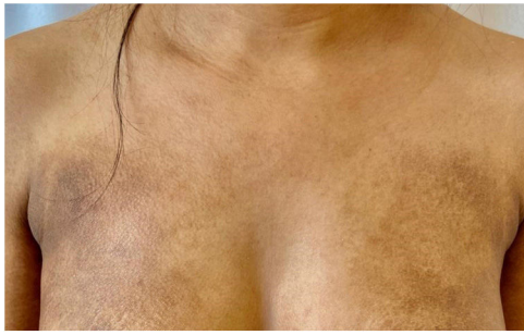
Figura 2 Placas hipercrômicas com descamação ictiosiforme no tronco anterior.