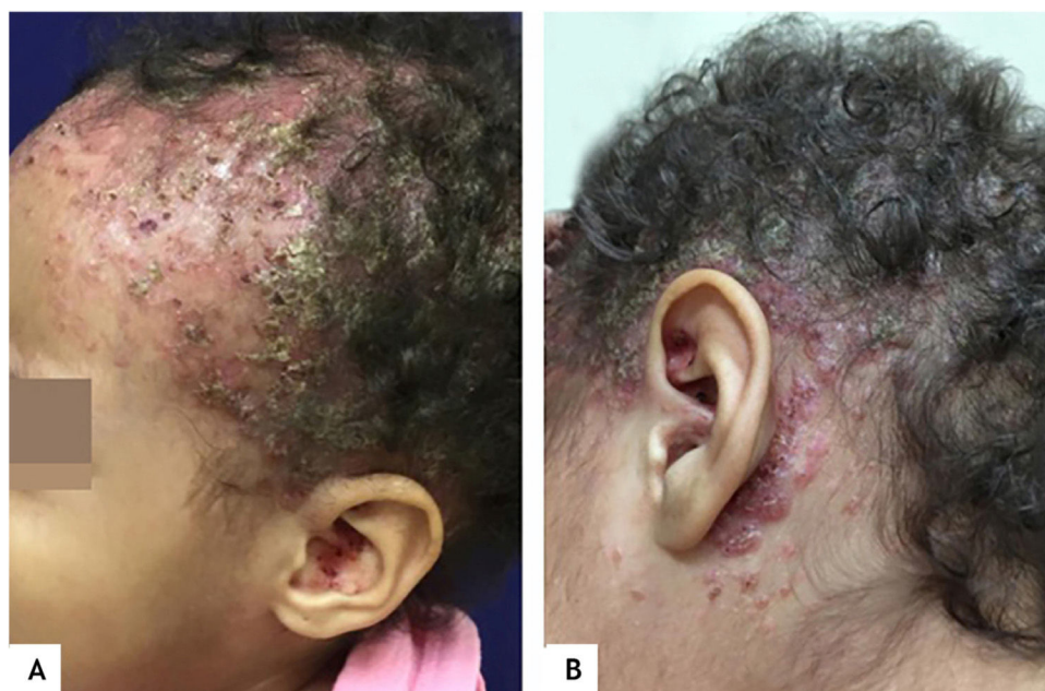
Figura 1 (A), Lesões eritemato-descamativas, infiltradas, recobertas por crostas hemáticas e melicéricas em todo o couro cabeludo e pavilhão auricular. (B), Pápulas eritematosas coalescentes, encimadas por crostas hemáticas e melicéricas se estendendo desde a região temporal até retroauricular.