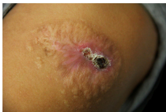
Figura 3 Placa infiltrada com crosta sero-hemática central com 18 meses de tratamento. Onze meses com itraconazol seguidos por sete meses de terbinafina associados a 11 sessões de criocirurgia com intervalos mensais.

Sporothrix e inibição do biofilme nas fases leveduriforme e filamentosa. 4,5 É também alternativa em gatos refratários ao itraconazol. 6 A criocirurgia foi utilizada com sucesso em 199 pacientes com resposta lenta ou refratária tratados com itraconazol/terbinafina. 7