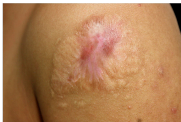
Figura 4 Lesão completamente cicatrizada após 20 meses de evolução e dois meses de tratamento com solução saturada de iodeto de potássio.

O perfil de sensibilidade antifúngica do isolado clínico identificado molecularmente como S. brasiliensis , realizado por meio do método CLSI M38-A2, apresentou as seguintes concentrações inibitórias mínimas (MIC):