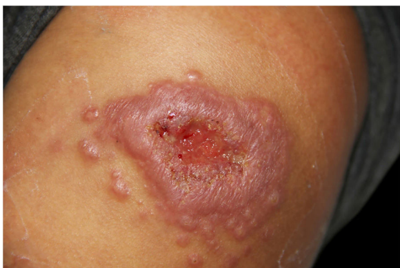
Figura 1 Placa infiltrada com ulceração central circundada por múltiplas pápulas satélites com 75 dias de evolução.