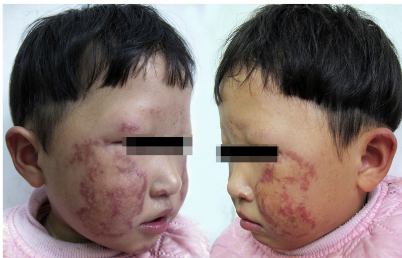
Figura 1 Poiquidermia em paciente com RTS. Despigmentação, hiperpigmentação, atrofia puntiforme, telangiectasia e perda de sobrancelhas observadas bilateralmente na face.