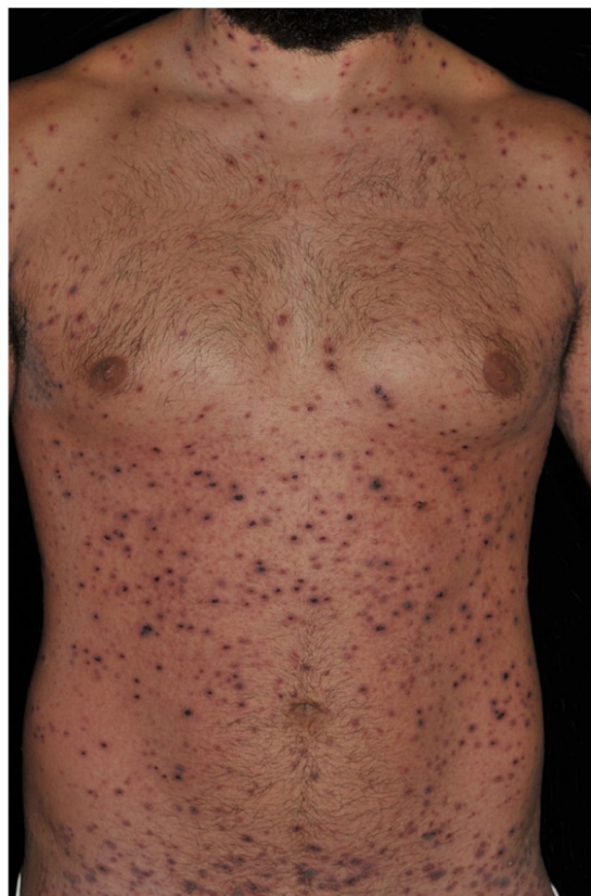
Figura 1 PLEVA: inúmeras vesículas de conteúdo hemorrágico e pápulas recobertas por crostas hemáticas. Pré-tratamento.

☆☆ Trabalho realizado no Departamento de Dermatologia e Radio-terapia, Faculdade de Medicina de Botucatu, Universidade Estadual Paulista, Botucatu, SP, Brasil.