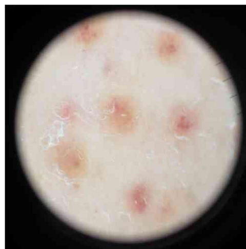
Figura 2 A dermatoscopia das lesões revelou pontos e glóbulos vermelho-acastanhados dispostos sobre um fundo de pigmentação vermelho-acobreada.

A biópsia da pele revelou adelgaçamento da epiderme, infiltrado liquenoide em faixa com linfócitos na derme papilar e reticular (fig. 3A), pequenos granulomas não necrotizantes na derme, formados por depósitos de células epitelioides e células gigantes multinucleadas, com uma pequena coroa linfoplasmocitária e sem necrose (fig. 3B). Foi observado extravasamento de eritrócitos e poucos eosinófilos, mas não havia vasculite. Depósitos de hemossiderina