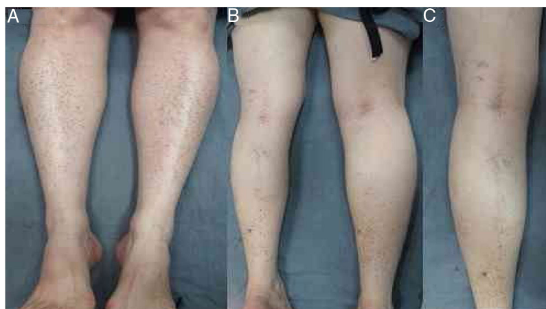
Figura 1 A, Paciente com máculas vermelho-acastanhadas e petéquias distribuídas simetricamente nas extremidades inferiores. B e C, Lesões na região posterior da perna esquerda com disposição linear e distribuição blaschkoide.

pigmentada de Gougerot e Blum, púrpura eczematoide de Doucas e Kapentanakis e líquen aureus . 1 Os achados histológicos clássicos incluem um infiltrado linfocítico perivascular e superficial, extravasamento de eritrócitos e depósitos de hemossiderina, sem vasculite. Uma variante granulomatosa da DPP foi descrita recentemente, cuja principal característica histológica é a presença de granulomas não necrotizantes associados aos achados clássicos da DPP. 2