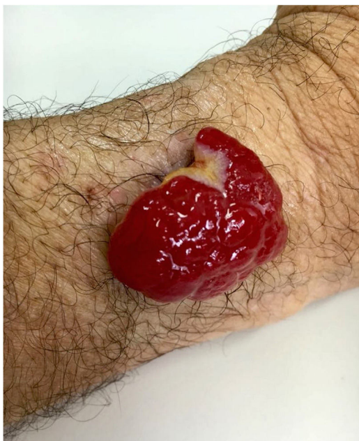
Figura 1 Nódulo eritematoso exofítico, 4,5 cm no maior diâmetro, no antebraço esquerdo.

Relatamos um paciente do sexo masculino, 45 anos, portador de espondilite anquilosante, em uso de adalimumabe havia cinco anos. Há quatro meses, notou pápula eritematosa em antebraço direito, que evoluiu com tumoração vegetante, de crescimento rápido, friável, de coloração vermelha, com cerca de 4,5 cm de diâmetro (figs. 1 e 2). Queixava-se de dor e episódios de sangramento espontâneo. Foi feita a exérese da lesão. Exame histopatológico mostrou nódulo ulcerado. Na derme superficial, havia proliferação de pequenos vasos e intenso infiltrado inflamatório de neutrófilos com deposição de fibrila, além de células gigantes de corpo estranho que fagocitavam material exógeno refringente. Na derme profunda, proliferação de vasos capilares dilatados em meio a infiltrado inflamatório plasmocitário e histiocitário, compatível com hemangioma capilar lobular (figs. 3 e 4). O paciente mantém o uso de adalimumabe sem surgimento de novas lesões.