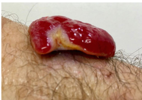
Figura 2 Tumoração pedunculada.